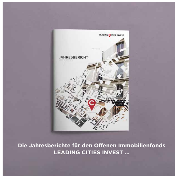
Die Jahresberichte für den Offenen Immobilienfonds LEADING CITIES INVEST ...

Als Leadagentur betreut MPM sämtliche Print- und Digital-medien