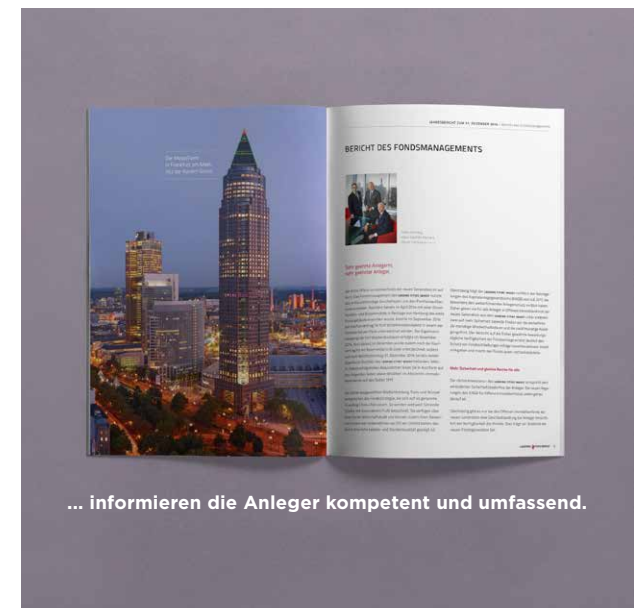
... informieren die Anleger kompetent und umfassend.