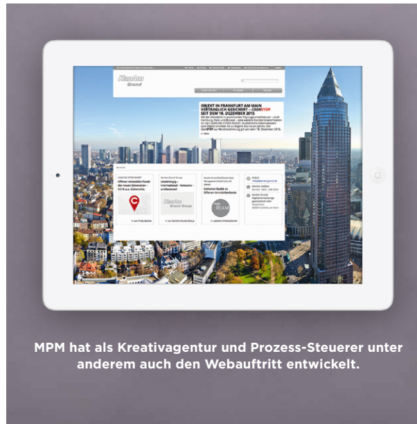
MPM hat als Kreativagentur und Prozess-Steuerer unter anderem auch den Webauftritt entwickelt.

Die verlässliche Kommunikation der Gesellschaft auf hohem kreativem Niveau trifft die Anforderungen der Anleger und der Vertriebspartner. Inhaltliche Transparenz und Substanz sind gewährleistet. Gleichzeitig ermöglicht das Digital Publishing Center durch seinen reibungslosen Workflow eine besonders einfache und schnelle Umsetzung der Marketing-, Vertriebs- und Investor-Relations-Medien.