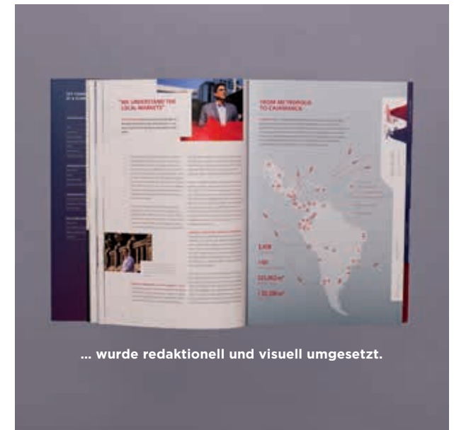
... wurde redaktionell und visuell umgesetzt.