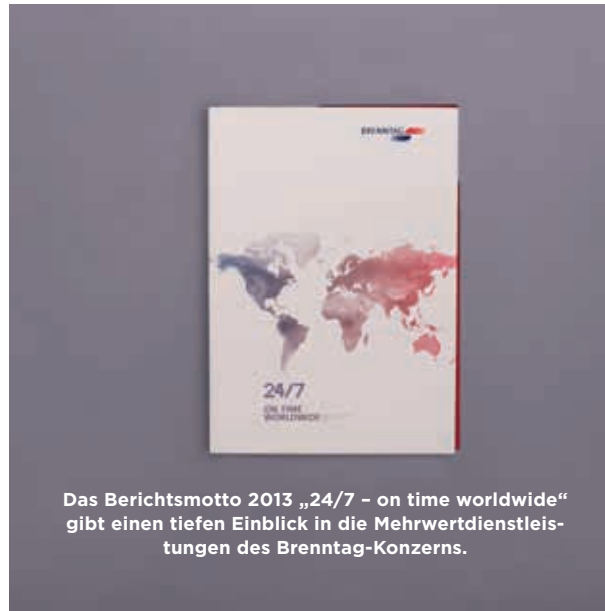
Das Berichtsmotto 2013 „24/7 - on time worldwide“ gibt einen tiefen Einblick in die Mehrwertdienstleistungen des Brenntag-Konzerns.