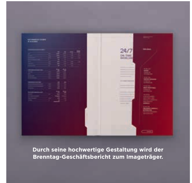
Durch seine hochwertige Gestaltung wird der Brenntag-Geschäftsbericht zum Imageträger.