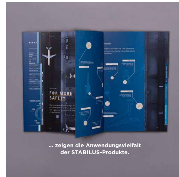
... zeigen die Anwendungsvielfalt der STABILUS-Produkte.