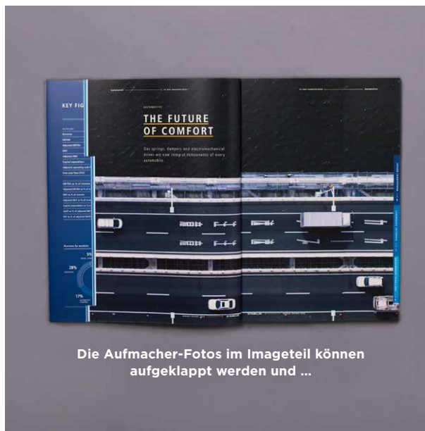
Die Aufmacher-Fotos im Imageteil können aufgeklappt werden und ...

Der Geschäftsbericht 2014 zeigt die Anwendungsvielfalt und die Produktionskompetenz von STABILUS und trägt so zu einer stärkeren internationalen Wahrnehmung des Konzerns bei. Der Imageteil verdeutlicht, dass die Gasfedern und Dämpfer von STABILUS mit ihren zahlreichen Anwendungsmöglichkeiten Teil des Alltags von Menschen weltweit sind. Neben der Konzeption lag auch die grafische Umsetzung bei MPM.