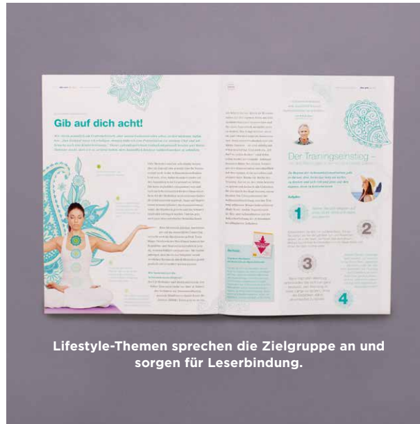
Lifestyle-Themen sprechen die Zielgruppe an und sorgen für Leserbindung.

Mit frischem Design kann „alles gute für dich“ auch etablierten Apotheken-Zeitschriften Konkurrenz machen, bestehende Zielgruppen ansprechen und neue erschließen. Informative Beiträge mit hohem journalistischem Anspruch und umfassend aufbereiteten Schwerpunktthemen bieten einen Mehrwert zum bisherigen Angebot und stärken somit die Markenidentität von STADA. Mit einer Auflage von 100.000 Exemplaren liegt „alles gute für dich“ in 4.000 Apotheken bundesweit aus.