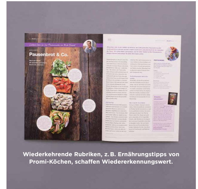
Wiederkehrende Rubriken, z.B. Ernährungstipps von Promi-Köchen, schaffen Wiedererkennungswert.